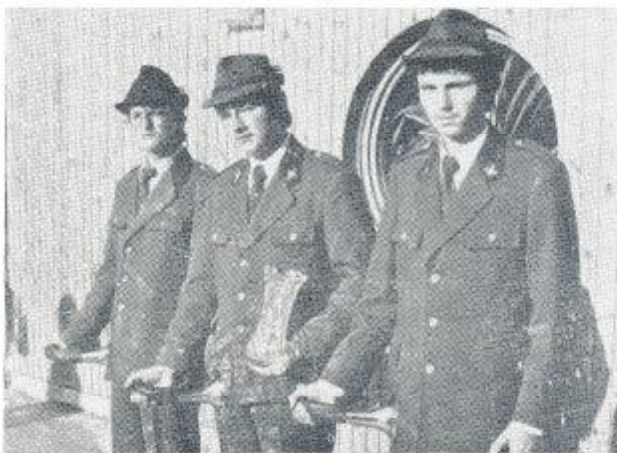
Víťaz plateho ročníka v kategórii súborov: študenti SOUL B. Štiavnica

Tretí ročník sa uskutočnil v dňoch 30. a 31. mája 1980 v Durdovom, v Pružinskej doline, v okrese Považská Bystrica. V malebnom prostredí pod skalami Strážovskej hornatiny sa viacerí zo súťažiacich stretli už po tretíkrát. Treba poznamenať, že v dôsledku úprav finančného hospodárenia vo Vydavateľstve Obzor, redakcia PaR odovzdala usporiadanie tohto ročníka ÚV SPZ, ktorý organizáciou súťaže opäť poveril OV SPZ v Považskej Bystrici. Súdruhovia aj tentokrát zvládli svoju úlohu k spokojnosti