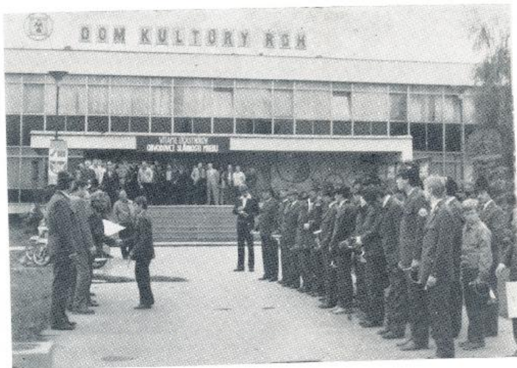
Miesto súťaže VI. ročníka Dom kultúry ROH Púchov

Piaty ročník sa uskutočnil 27. novembra 1982 v Dome poľovníkov v Pov. Bystrici, súťaže sa