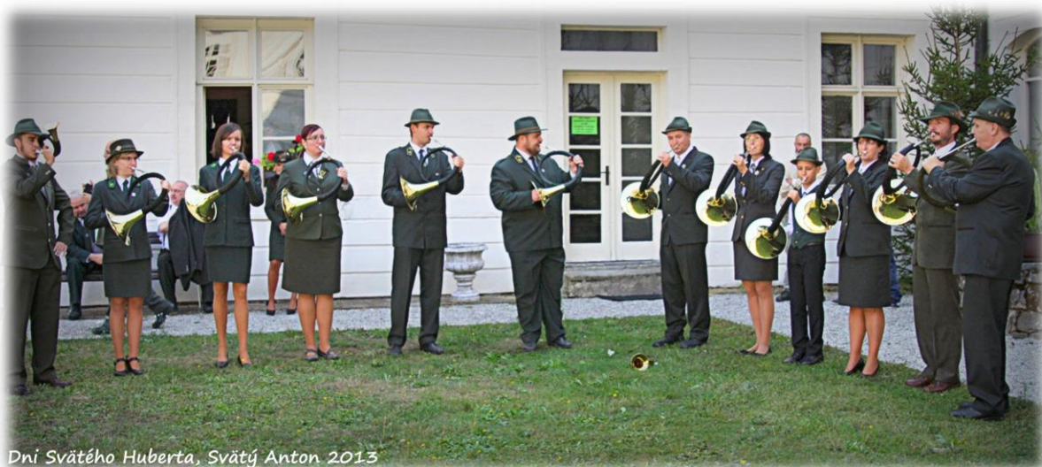
Dni Svätého Huberta, Svätý Anton 2013